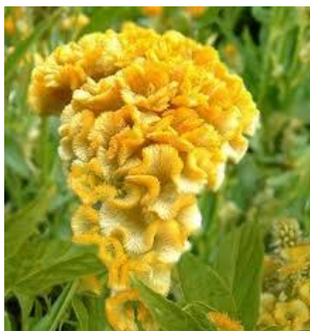
Celosia cristata gialla

Nell'arco fiorito l'equilibrio cromatico sarà invece a favore delle tonalità rosso-arancio giallo che avranno peso 8, il verde avrà peso 5 e le due canne di sostegno rappresenteranno il peso 3 del marrone. Per le composizioni alla base dell'arco i pesi cromatici saranno 8 rosso (canne indica e strelizie) 5 verde e 3 giallo (strelizie e celosia)