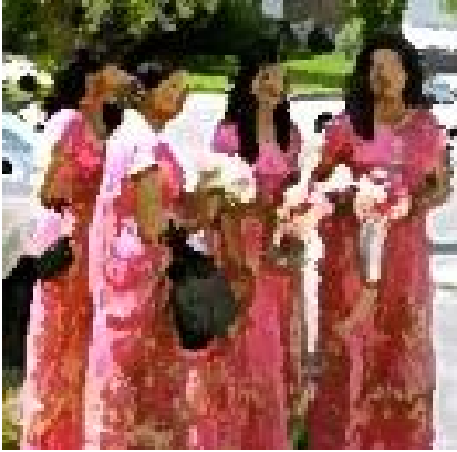
Alcune invitate in abito tradizionale