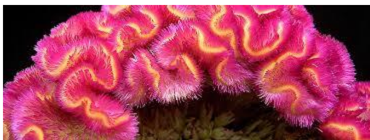
Celosia cristata rosa/gialla