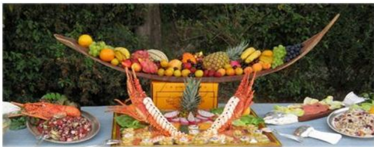
Idea per presentazione cibo