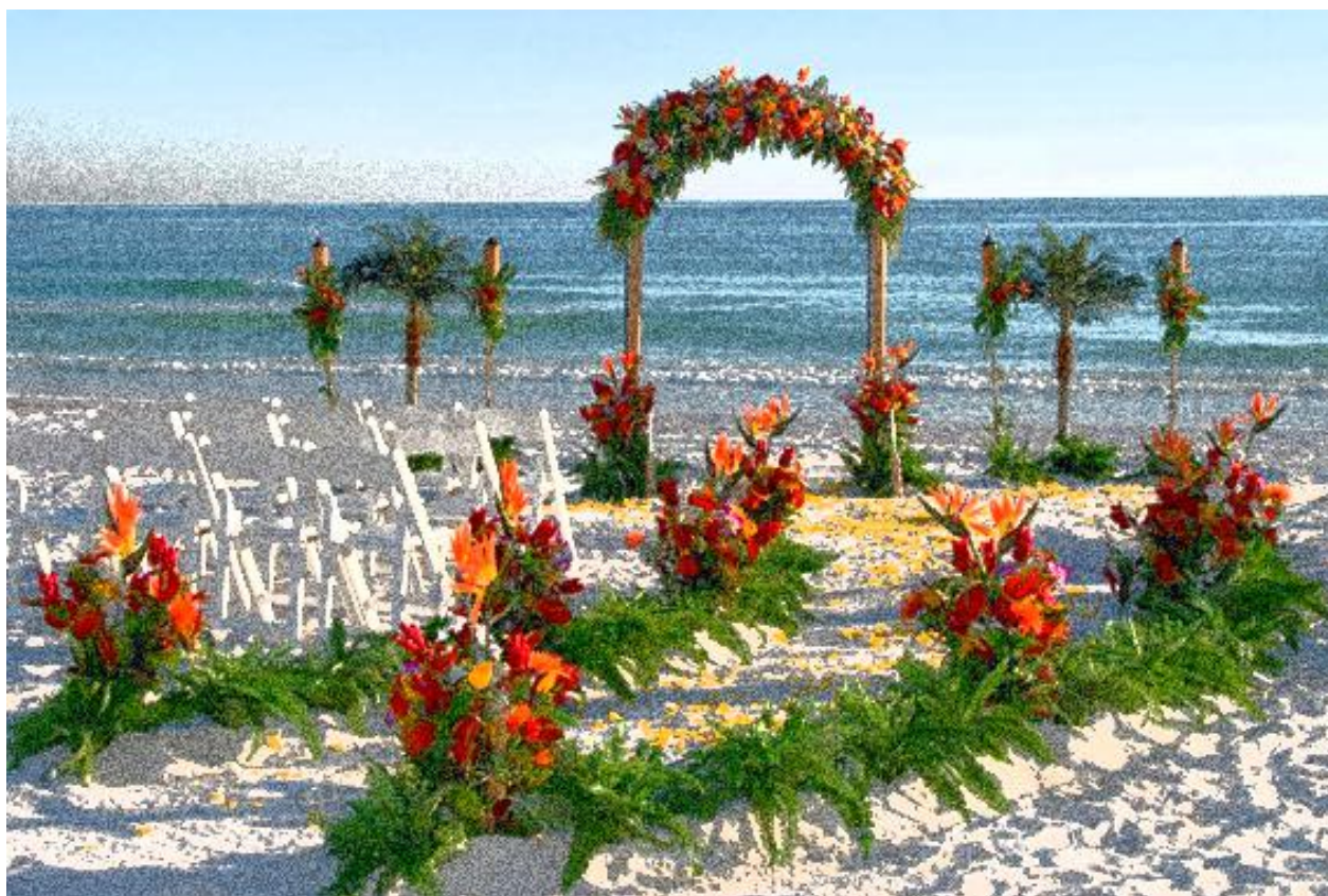
Visione d'insieme ambientazione cerimonia sulla spiaggia

La Sposa vestirà un Sari rosso e oro e lo Sposo il tradizionale Kurta bianco e oro.