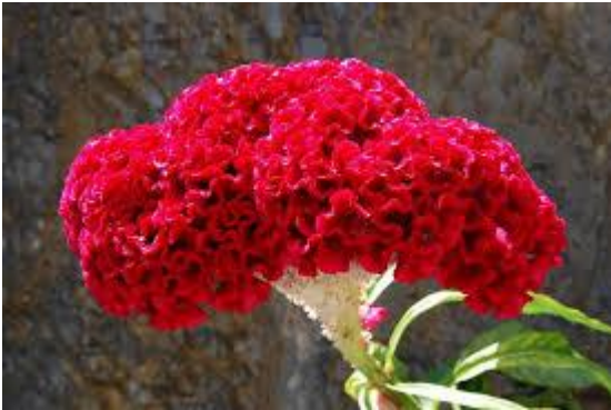
celosia cristata rossa