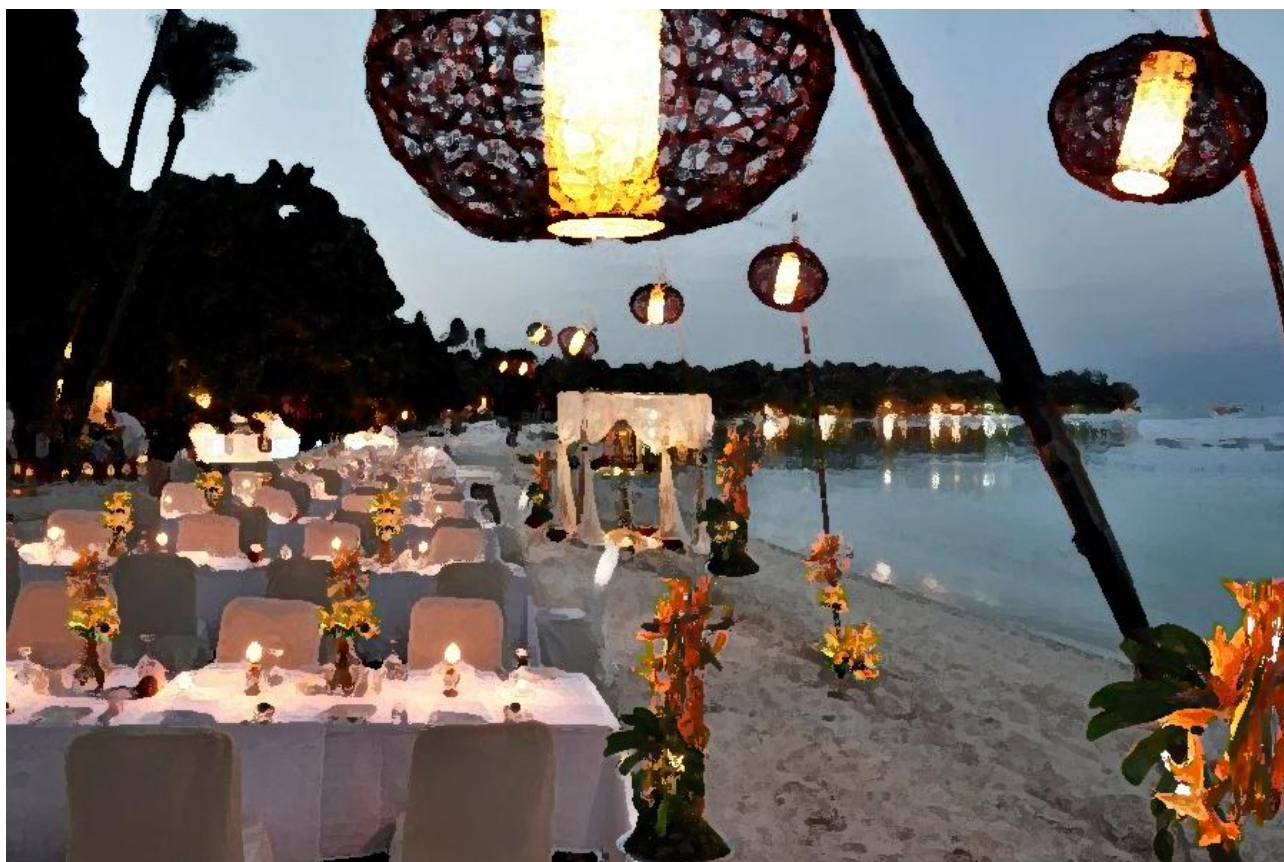
Visione d'insieme area cena

19 tavoli che ospiteranno il cibo e le bevande per il buffet saranno decorati con altrettante composizioni che verranno poste tutte sull'angolo anteriore destro del tavolo a scandire in maniera ritmica la sequenza degli stessi.