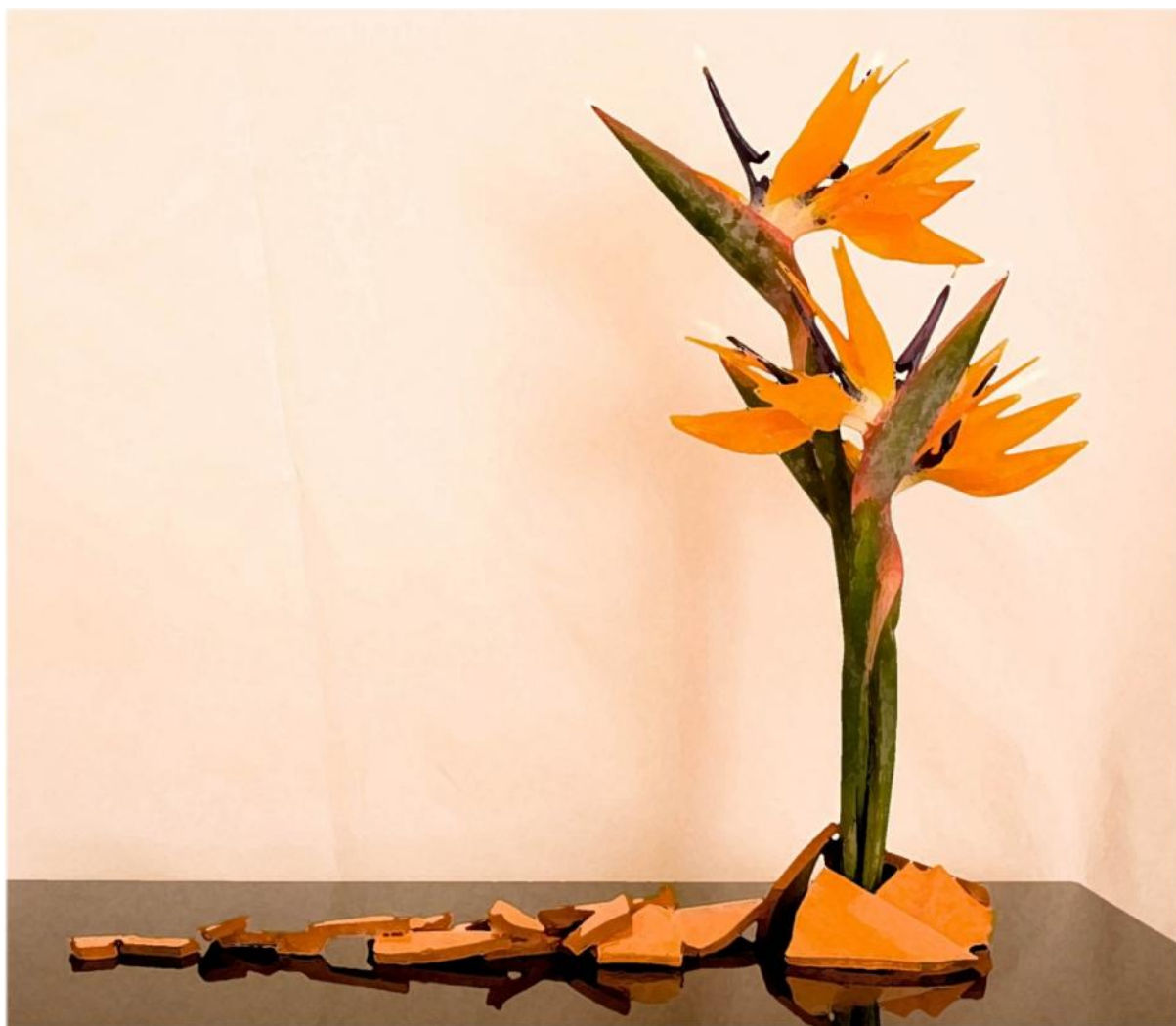
Composizione tavolo buffet