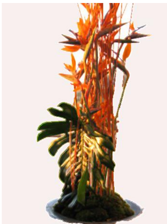
Composizione a terra area cena

6 grandi composizioni posizionate a terra tra gli arredi completeranno l'ambientazione. Le composizioni saranno composte da strelizie e foglie di monstera .